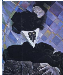
Max Ernst, Euclide, 1945