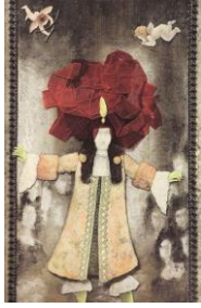
Illustration de Frédéric Clément