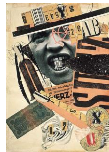
Raoul Hausmann ABCD, 1923, 1924 40,4 x 28,2 cm Centre Pompidou Paris

Chercher les liens entre ces trois images. Imaginer un titre et comment ces images ont pu être composées. Lire les cartels. Comment réaliser un collage à partir d'un nom de chapeau? le chapeau parfum, casserole, tour Eiffel... Collecter et faire des choix d'images dans la boîte de la classe