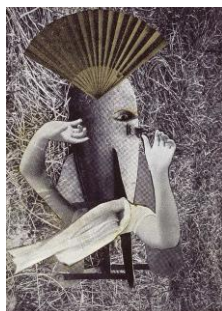
Max Ernst, Le rossignol Chinois, 1920, photomontage, 12,2 x 8,8 cm, Musée de Grenoble