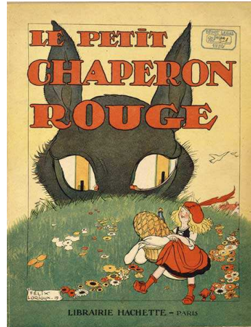
Illustration de Félix Lorioux pour la couverture du Petit Chaperon rouge, Paris, Librairie Hachette, 1920 (30 x 23,7 cm), BnF Estampes et photographies

le loup dévore de ces yeux jaunes un petit chaperon rouge déluré