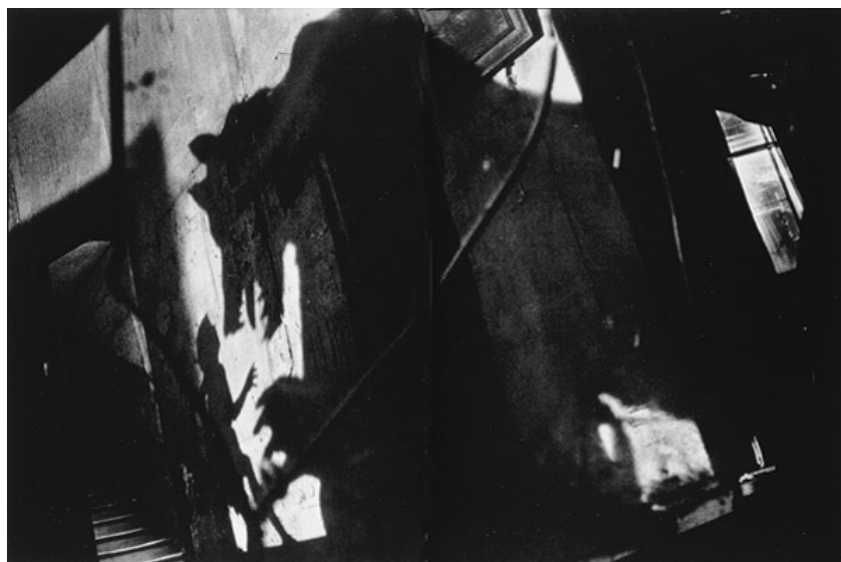
Photographie de Sarah Moon (photographe de mode et de publicité) pour le Petit Chaperon Rouge de Charles Perrault, Paris, Grasset, « Monsieur Chat », 1983

Demander aux enfants de les ranger chronologiquement avant même de les présenter.