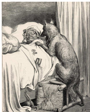
Illustration par Gustave Doré pour le Petit chaperon rouge dans Les contes de Perrault, Paris, Jules Hetzel, 1862, Gravure sur bois par Adolphe-François Pannemaker (33 x 27 cm), BnF, Estampes et photographies

Découverte de l'illustration de Gustave Doré (le petit chaperon rouge, la scène du loup qui arrive dans la maison de la grand-mère)