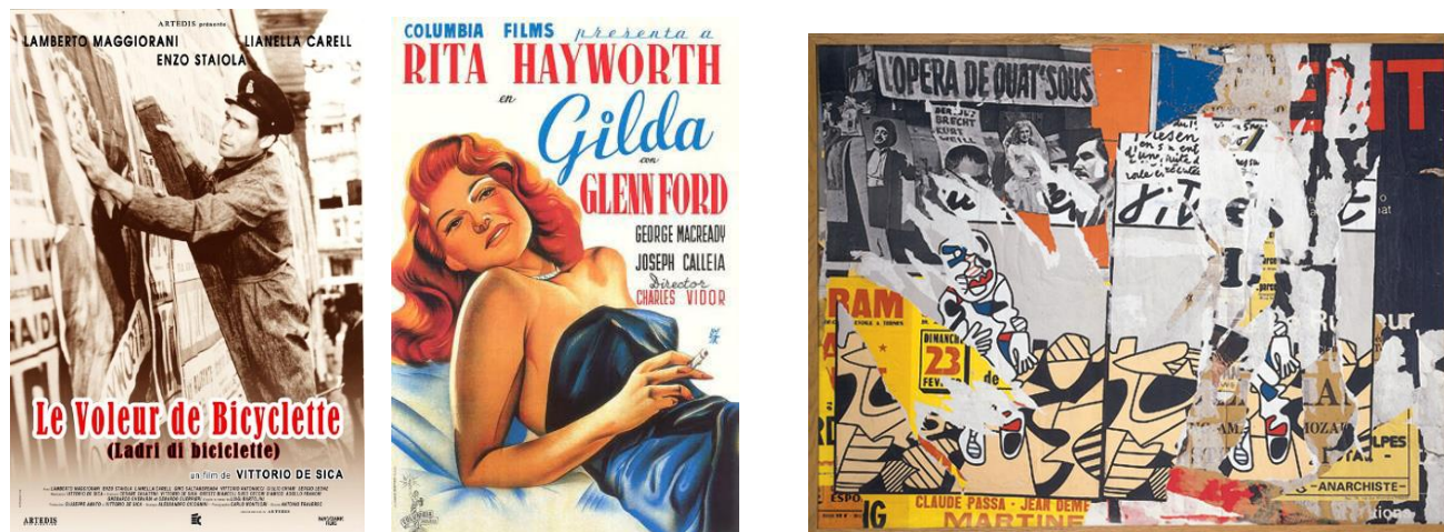
Rue du Grenier Saint-Lazare, mardi 18 février 1975 Affiches lacérées marouflées sur toile, 89 x 116 cm Collection Fonds régional d'art contemporain Bretagne

Quel artiste utilise ce matériau pour s'exprimer ? (voir le lien )