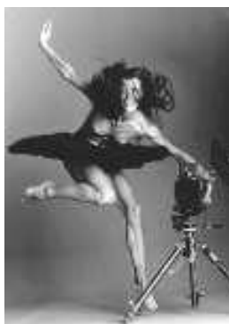
Autoportrait de Sylvie Guillem

Réaliser son propre autoportrait (à l'aide de miroir, à partir d'une photographie, avec un appareil photo et un miroir, ...)