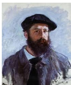
Autoportraits de Matisse