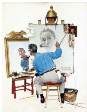
Triple autoportrait de N. Rockwell.