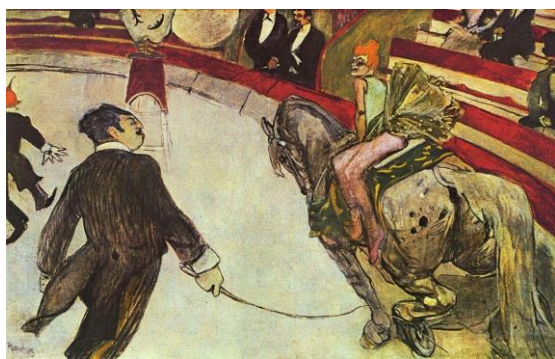
« Au cirque Fernando : écuyère », Toulouse LAUTREC Huile sur toile, 103,2x161,3cm 1887/88, Art Institute of Chicago

http://www4.ac-nancy-metz.fr/ia54-gtd/arts-et-culture/sites/arts-et-culture/IMG/pdf/JDTAcirque.pdf