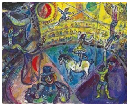
« Le cheval de Cirque », Marc CHAGALL Gouache sur papier, 49,4 x 61,8cm vers 1964, Collection particulière, Courtesy Hammer Galleries, New York