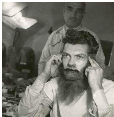
Jean Marais au maquillage

Evoquer les personnages principaux et leurs qualités et valeurs morales et symboliques, la belle et sa beauté, la bête et sa laideur, sa gentillesse et sa bonté.