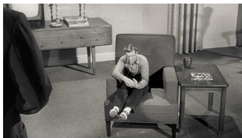
Champ/ Contre Champ