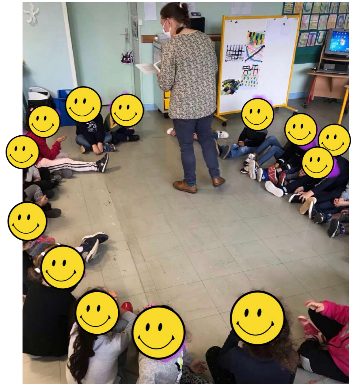
Il y a deux coins regroupement, un dans chacun des espaces.

Un coin regroupement sous forme plus traditionnelle mais avec des assises différentes : banquette, poufs, ballon, tapis, chaises individuelles ( en référence à la classe flexible). Il est utilisé lors de regroupements en effectif plus réduit . Les élèves peuvent choisir l'assise qui leur convient en fonction de leur capacité d'attention au moment de l'activité. C'est aussi à cet endroit que l'on utilise le vidéo projecteur.