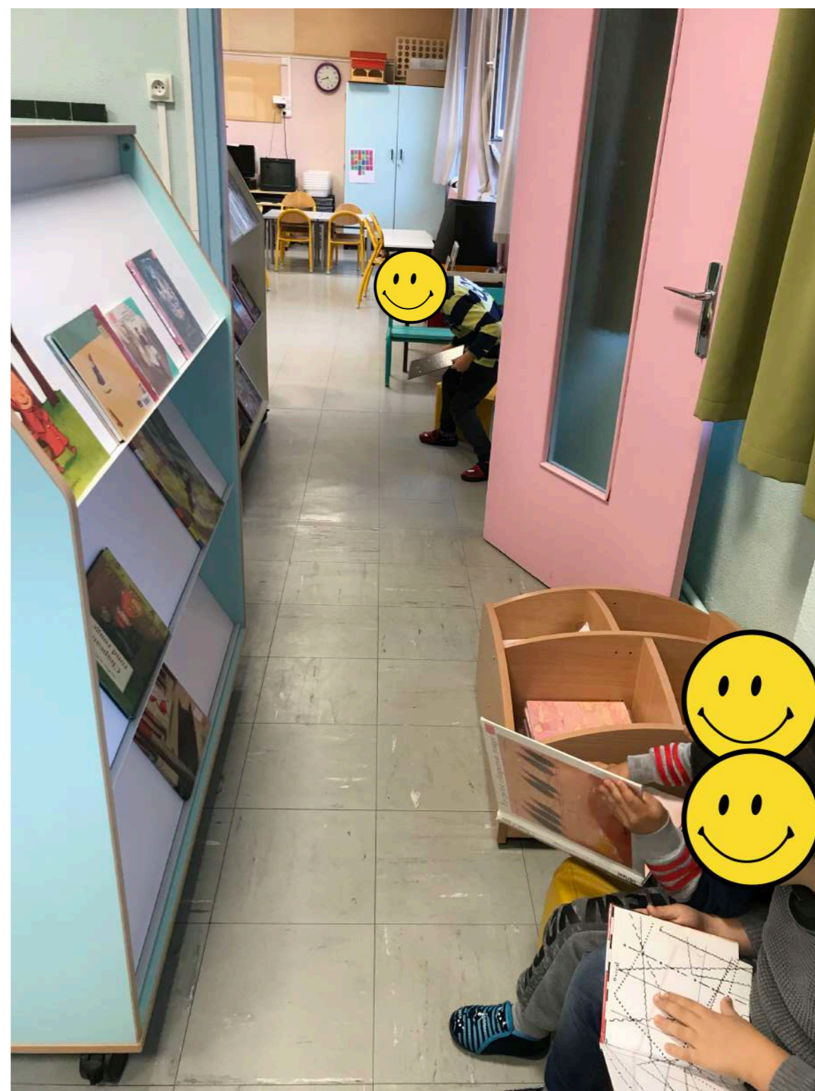
L'espace bibliothèque de classe est commun et fait le lien entre les 2 salles. Cet aménagement facilite le passage entre les 2 espaces . Les élèves passent d'un espace à l'autre et ils ont investi ceux-ci comme étant leur classe.