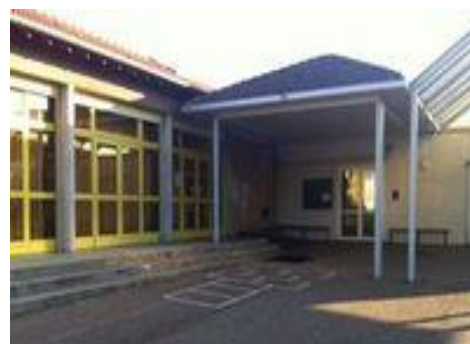
SAULXURES Chepfer primaire