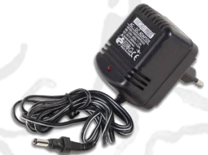
Bloc secteur 9V 8,10€