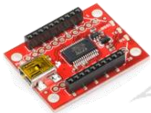
Platine interface USB pour Xbee 20,58€