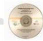
Logiciel « Organigram » 90 €