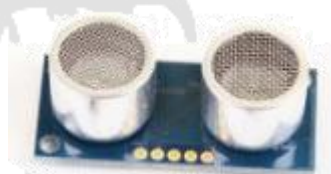
Télémètre ultrason 18,00 €