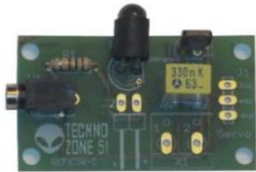
Détecteur de proximité 11,50 €