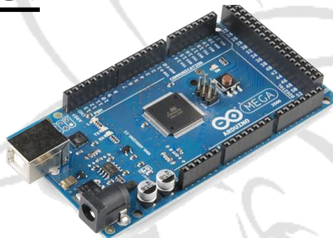
Carte Arduino Mega 2560 35 €