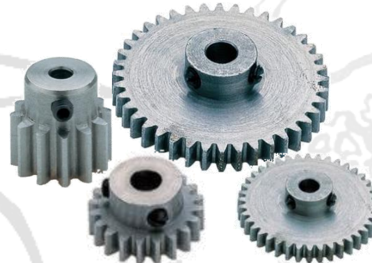
Plusieurs roues dentées différentes