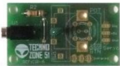
Capteur de température 6,00 €