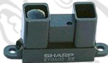
Télémètre infrarouge 17,50 €