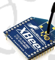
Module Xbee 2 x 20,00€