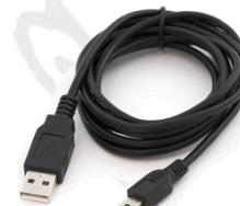
Cordon USB Mâle/ mini mâle 4,40€