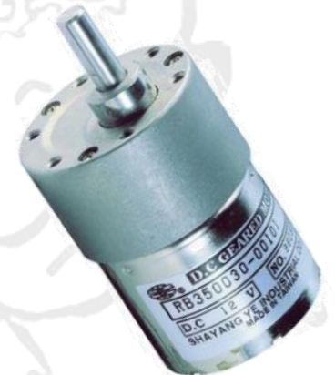
Moteurs 14,00 €