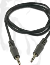
Câbles jack stéréo 2,5mm