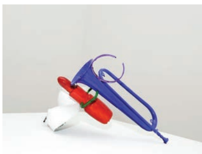
Jean-Luc Moulène, Voyelles , 2015.

Arts plastiques / arts visuels : centre d'art, lieu d'expression, de productions et de créations pour les artistes ; diversité des pratiques, matérialité, mise en espace des œuvres ; histoire du centre d'art, mémoire, archives, traces.