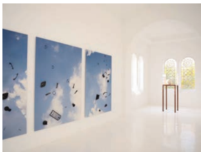
Shilpa Gupta, Vue de l'exposition Drawing in the Dark , CAC - la synagogue de Delme, 2017.