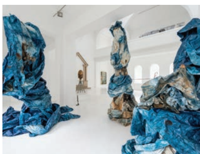
La Chose , 2014. Commissaire : Anne Bonnin

Arts plastiques / arts visuels : limites, frontières, territoires ; l'œuvre, l'espace et le visiteur ; matérialité de l'œuvre, nature et statut. Interdisciplinarité : Histoire - géographie, Éducation citoyenne, Lettres, Philosophie.