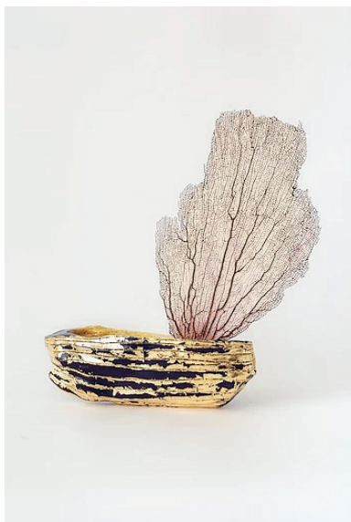
Romuald Dumas-Jandolo, Le bateau , céramique, 2017.