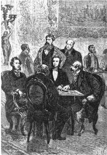
Le pari de Phileas Fogg.

Une vive discussion s'engage à propos de cet article. Phileas Fogg parie 20 000 livres, la moitié de sa fortune, avec ses collègues du Reform Club qu'il réussira à faire ce tour du monde en 80 jours . Il part immédiatement, emmenant avec lui Jean Passepartout, son nouveau valet de chambre. Il quitte Londres à 20 h 45 le 2 octobre, et doit donc être de retour à son club au plus tard à la même heure, 80 jours après, soit le 21 décembre 1872 à 20 h 45 heure locale.