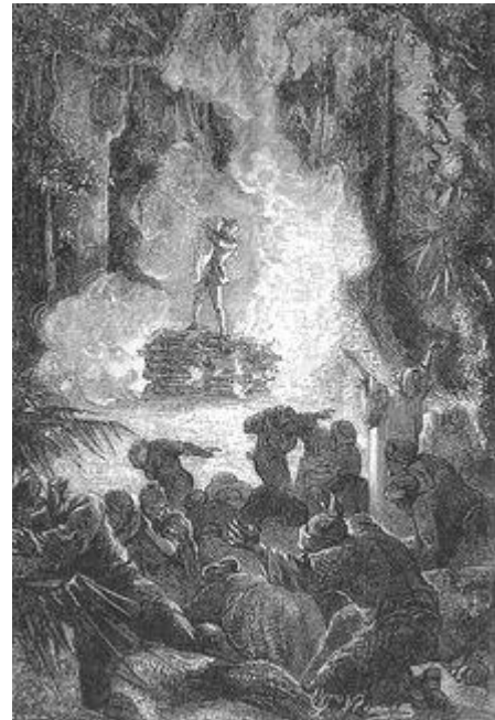
Le sauvetage de Mrs. Aouda.

Phileas Fogg est un maniaque de l'heure, qui aime agir de façon exacte et précise. Pour lui, « l'imprévu n'existe pas ». Mais le voyage va être semé d'obstacles et de contretemps.