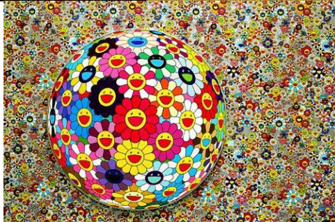
Flower ball , T. Murakami, 2002. https://fr.wikipedia.org/wiki/Takashi_Murakami