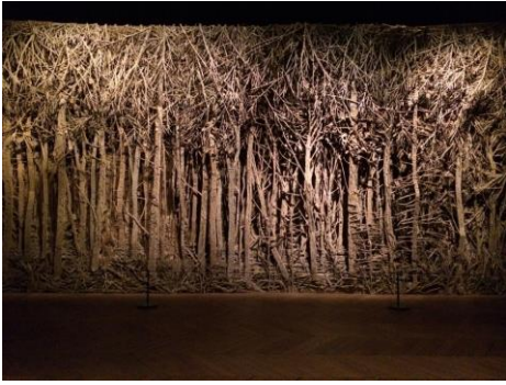
Forêt de Eva Jospin.

D'autres artistes ont travaillé à partir de carton et de papier :