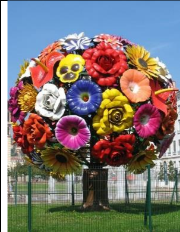
L'arbre à fleurs de Choi Jeong Hwa. https://fr.wikipedia.org/wiki/Choi_Jeong_Hwa

Tu peux aussi t'inspirer d'autres œuvres d'art qui représentent des fleurs :