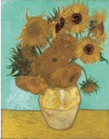
Les tournesols de Vincent van Gogh, peinture à l'huile, 1888-1889.