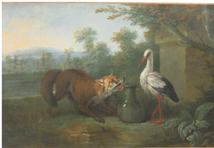
J.B OUDRY - Le Renard et la Cigogne Huile sur toile

Revenons à notre tableau. Prenons un petit temps pour l'observer.