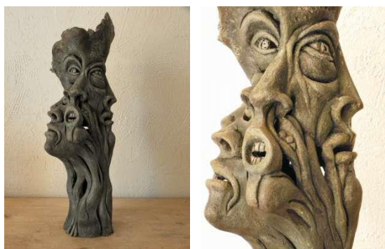
Terre patinée. Hauteur 50 cm Diam 20cm

Cette œuvre sculptée, en argile patinée peut permettre d'aborder la sculpture avec des élèves. C'est un des domaines des arts plastiques qui est peu exploré dans les classes car assez mal connu.