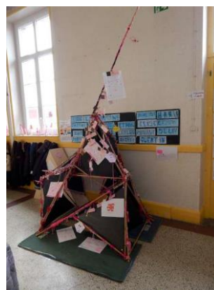
Réalisation à l'école Vautrin de Maxéville en juin 2017

Cette œuvre peut permettre d'aborder ce qu'est une « installation » avec des élèves, leur permettant d'expérimenter cela en classe.