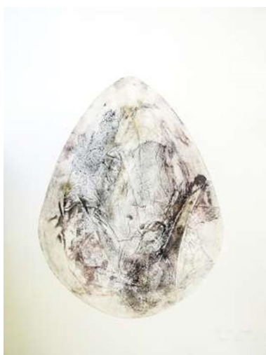
Collagraphie de la série des Grands Œufs imprimée sur papier coton, format 56/76 cm

Cette œuvre peut permettre d'aborder l'estampe et la gravure avec des élèves. C'est un des domaines des arts plastiques exploré régulièrement dans les classes, en référence aux grands graveurs lorrains.