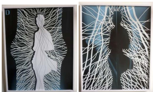
Dyptyque Radiographie/Dessin/Collage 30 x 37 cm

Cette œuvre peut permettre d'aborder le collage avec des élèves. C'est un des