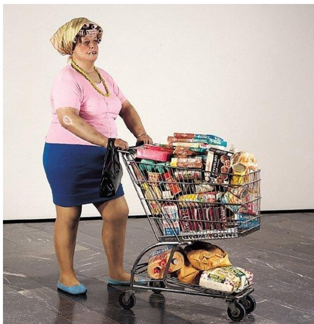
Duane Hanson - Supermarket lady 1969

→ Réaliser une installation à partir de sérigraphies