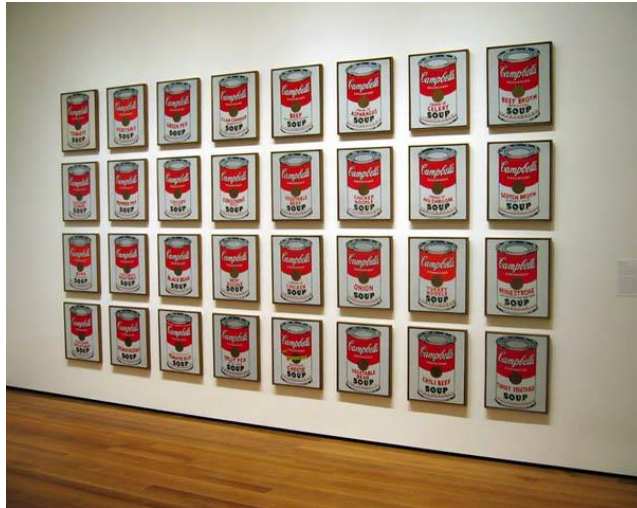
Andy Warhol – Campbell's Soup Cans – 1962

→ Réaliser une installation à partir de sérigraphies