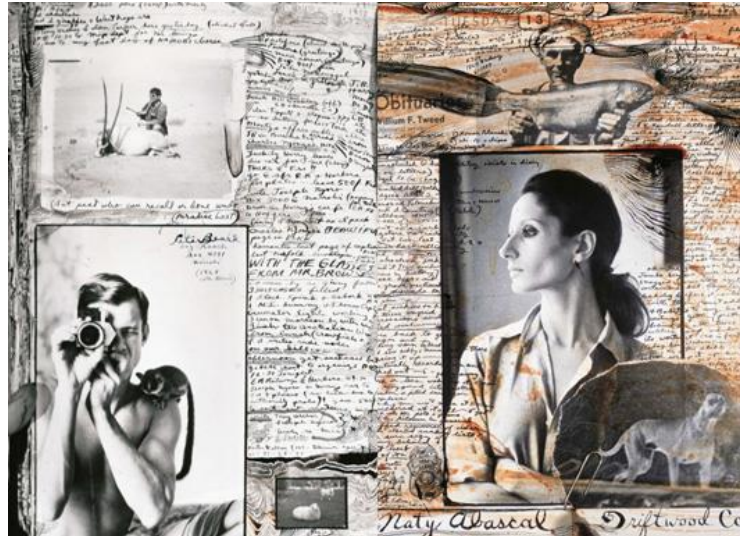
Peter Beard, Fin XX ème siècle

→ Modifier les photos à partir de traces et d'empreintes