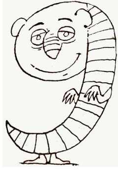
Le g ulu