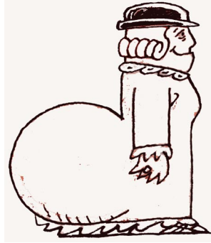
La d ame