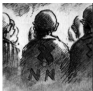
Dessin d'Henri Gayot

8) Quelles sont les nationalités des détenus qui arrivent au camp ?