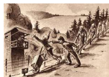
Dessin d'Henri Gayot

10) Comment est surnommé le lieu où se déroule cette scène ? Pourquoi ?