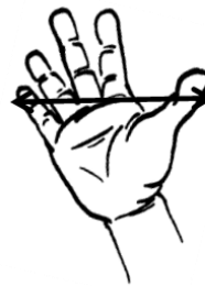
La longueur de l'épan correspond à 20 cm