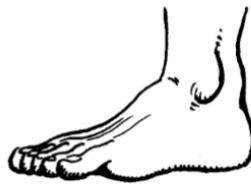
La longueur du pied correspond à 30 cm

A l'époque du roi Louis XIV, on utilisait comme unité de mesure le pied et le pouce du roi. Dans les livres, on peut lire que Louis XIV mesurait environ 5 pieds et 8 pouces.