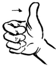
La largeur de ton pouce correspond à 3 cm

Autrefois, les hommes utilisaient des parties de leur corps pour mesurer des longueurs.