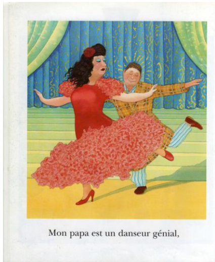
Illustration 1 :

Pistes de travail : (culture de différents pays)