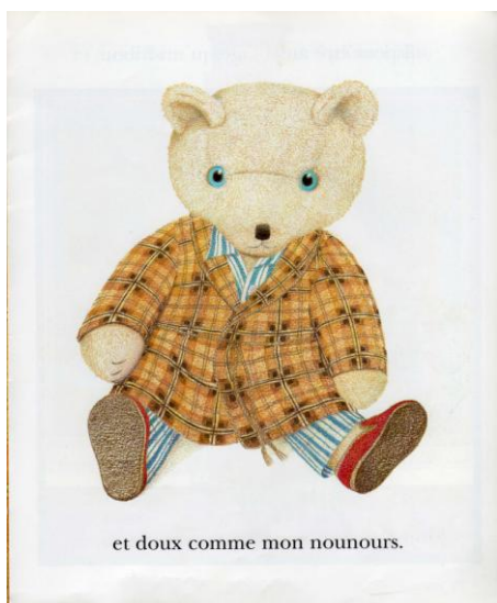
Illustration 3 : (à mettre en opposition avec l'illustration du lutteur)

Présenter : évaluer la pertinence de la proposition