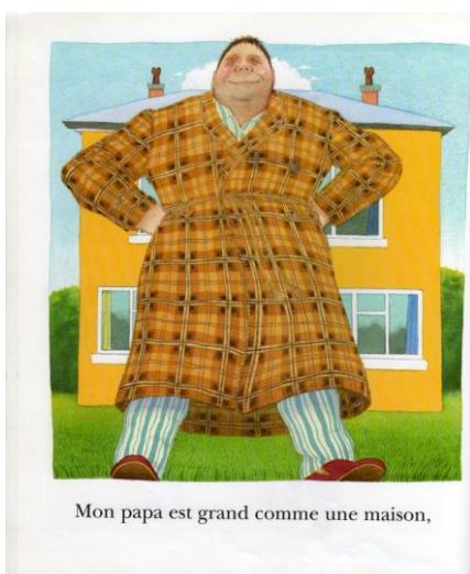
Illustration 2 :

Pistes de travail : (en lien avec la notion de grand/petit et les comparatifs)