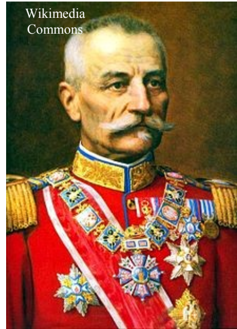
Portrait de Pierre Premier roi de Serbie

La Serbie étant l'alliée de la France et de la Russie, il est impensable que ces pays restent sans réaction. La guerre est inévitable.