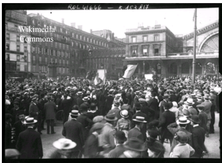
Paris: ambiance en ce 2 août.